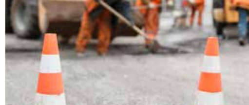
Werken in Wersbeek p. 3