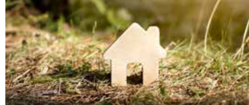
Vriendjespolitiek bij regularisatie woning? p.3