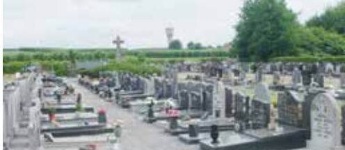
Concessiereglement een flop? p.2