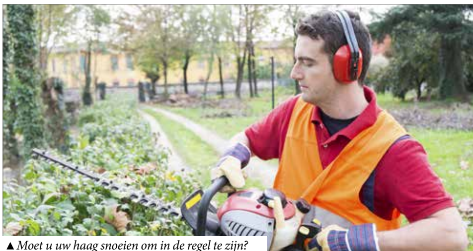
▲ Moet u uw haag snoeien om in de regel te zijn?

Beplantingen of constructies mogen het zicht van en op fietsers en autobestuurders niet hinderen. Dat staat nu ook zwart op wit in een reglement dat inging op 1 juni 2017. Een goede zaak voor de veiligheid in de Bekkevoort, vindt de N-VA. Maar het reglement bevat enkele belangrijke gebreken. Daarom onthielden wij ons bij de stemming hierover.