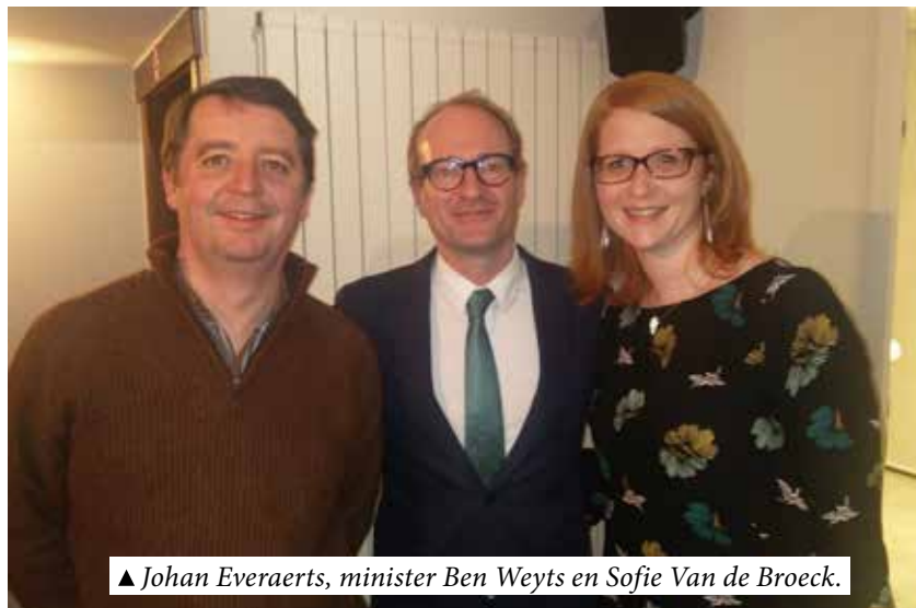
▲ Johan Everaerts, minister Ben Weyts en Sofie Van de Broeck.

Gaat dierenwelzijn samen met feesten? In Bekkevoort blijkt niet op oudejaarsavond. Ondanks de oproep van bevoegd minister Ben Weyts om rekening te houden met de dieren in je omgeving werd er toch op meerdere plaatsen vuurwerk afge-stoken. Dat de luide knallen dierenleed veroorzaken, zowel voor de huisdieren als de dieren in de omliggende weides, is algemeen geweten. Toch wordt daar blijkbaar weinig rekening mee gehouden.