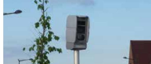
Hoeveel kost deze flitspaal? p. 3