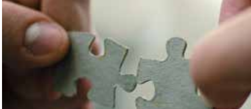
N-VA is voor gemeentefusie p. 2