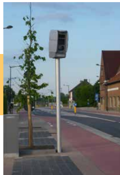
▲ Deze flitspaal kost u maar liefst 80 000 euro

... de put op het einde van de Minnestraat in Assent nu al twee keer gedicht is ? Helaas is dit weer geen blijvende oplossing. Binnenkort zullen de automobilisten opnieuw moeten opletten, want het wegdek is al opnieuw aan het verzakken. De gemeente reageert pas na aandringen van de inwoners eer ze snel-snel iets doet. Dit soort half oplapwerk komen we spijtig genoeg te vaak tegen in onze gemeente. Van enige opvolging van de werken is al helemaal geen sprake.